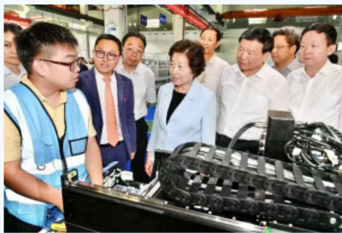
中共中央政治局委员、国务院副总理孙春兰