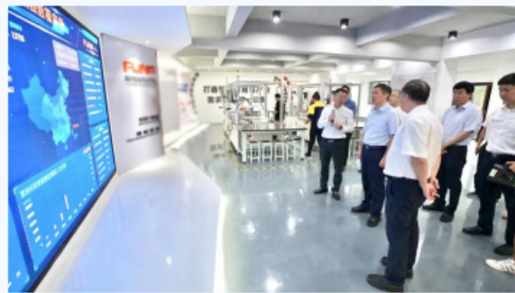
教育部副部长钟登华