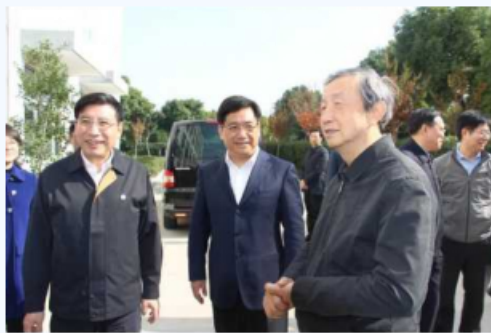
原国务院副总理马凯