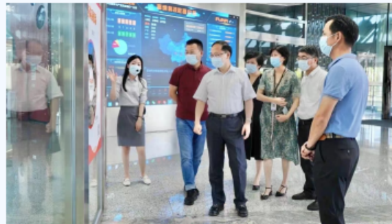
苏州市人民政府副市长查颖冬