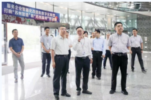
江苏省人社厅副厅长顾潮