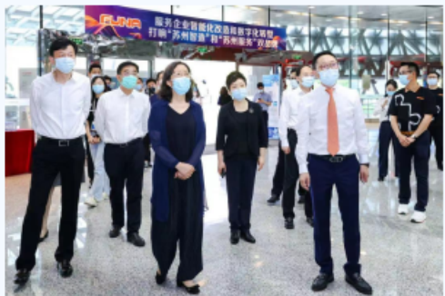
江苏省副省长陈星莺